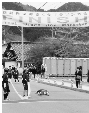
(最近参加したマラソン大会にて)ゴール直後の私。

30数年の私の生涯において、どちらかというインドアの時間が多かったので、実際走るのは大変ですが、友人と