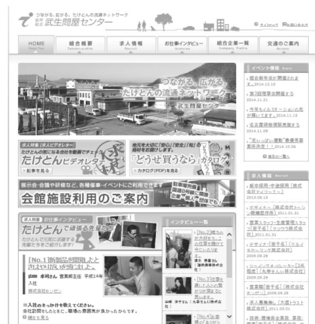
ホームページ（トップページ）

今後は、課題となっている組合員の販路拡大の支援に向け、「組合ネットショップ」の開設を構想中である。現在青年部を中心に「ネットショップ研究会」を立ち上げ、実現化に向け活動を続けていく方針である。